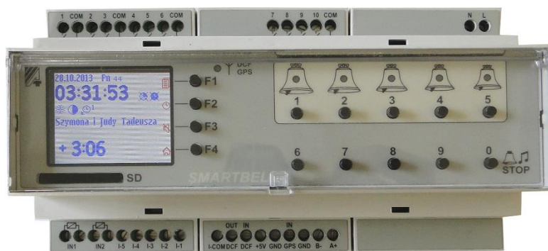
Zegar sterujący Smart Bell